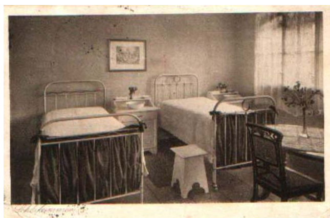
Wnętrze sali sypialnej w szkole gospodarczej dla dziewcząt w pałacu „Hugoschloss” - lipiec 1923